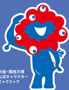
大阪・関西万博 公式キャラクター ミャクミャク